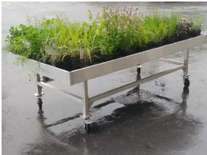
Volop water in juli voor onze kruidenplantjes.