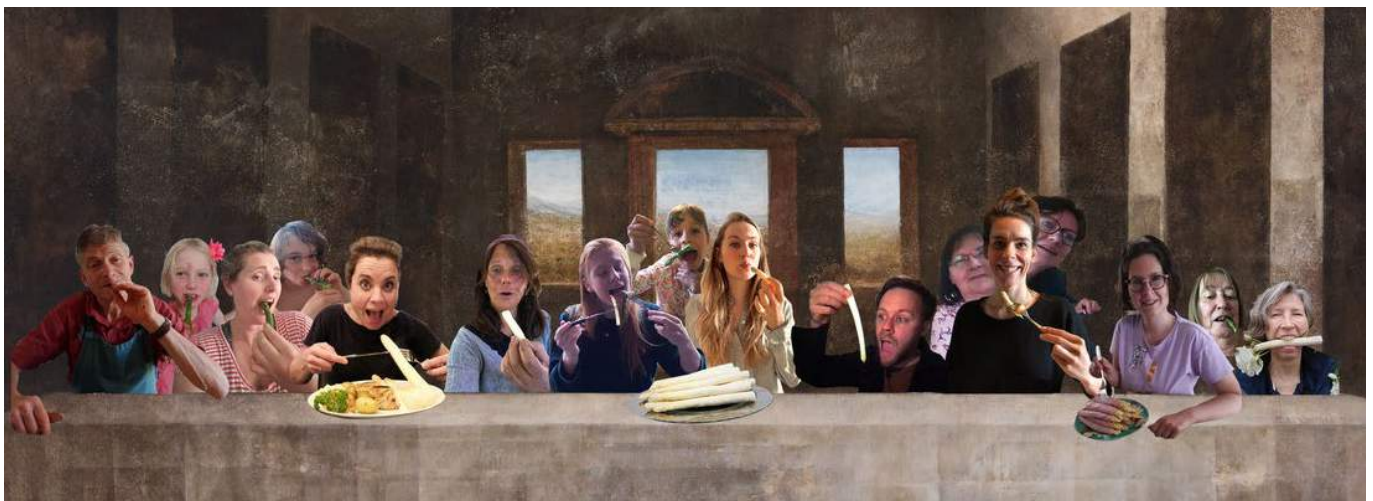
Ook in juni: samen asperges eten in Corona tijd.