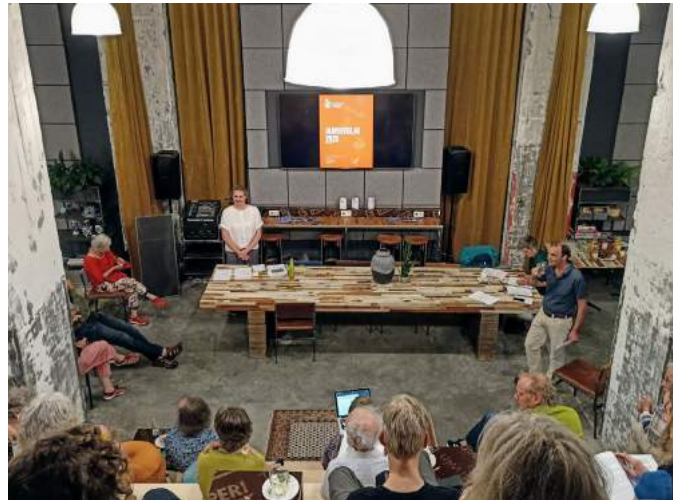
Algemene Ledenvergadering in juni.