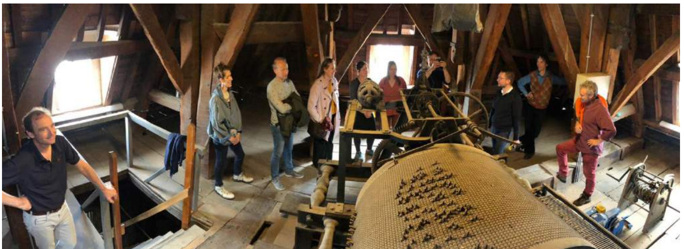
Uitstapje ondernemersleden naar de klokkenluider van het stadhuis in mei.