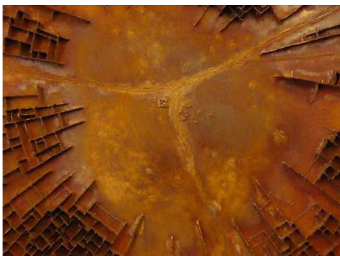
Dit prachtige kunstwerk van Rob van Acker werd in augustus in ons café geïnstalleerd.