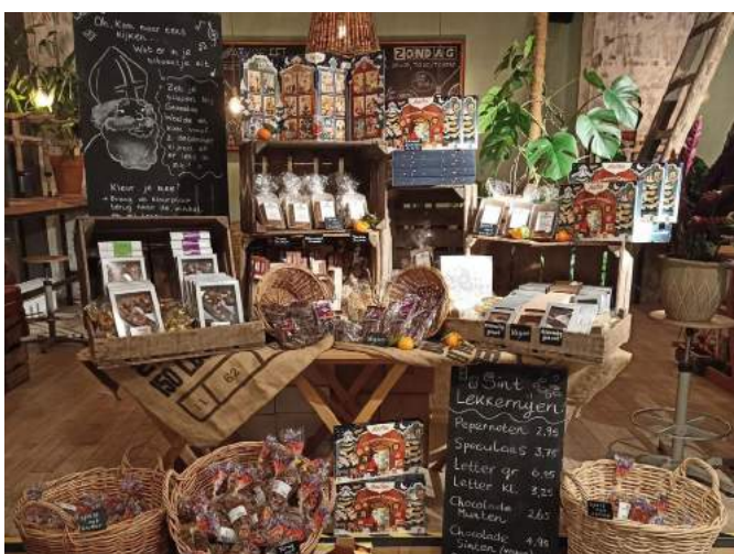
Sinterklaas is begin december in het land.