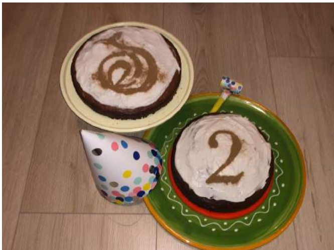
Het resultaat, vele lekkere taartjes!