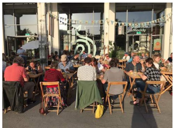
... en 's avonds een ledenetentje als afsluiting.