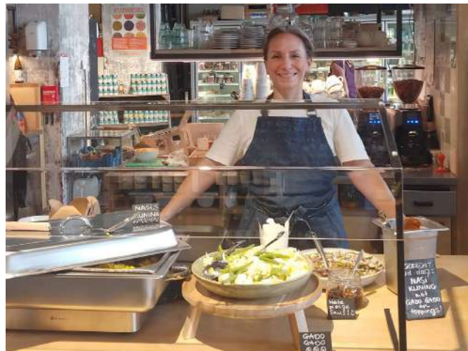
Ook in juli: het startsein van ons nieuwe lunchconcept.