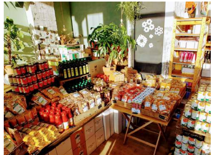
In april hadden we een prachtige Italiaanse markt.