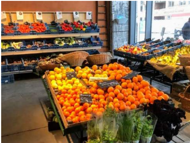
Volop verse groenten en fruit in januari voor alle goede voornemens.