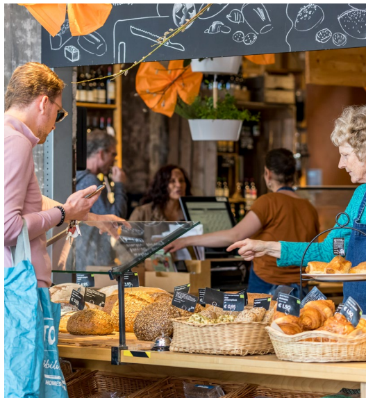
Toen de koning op 27 april Maastricht bezocht, kleurde ook Gedeelde Weelde dieper oranje dan normaal.