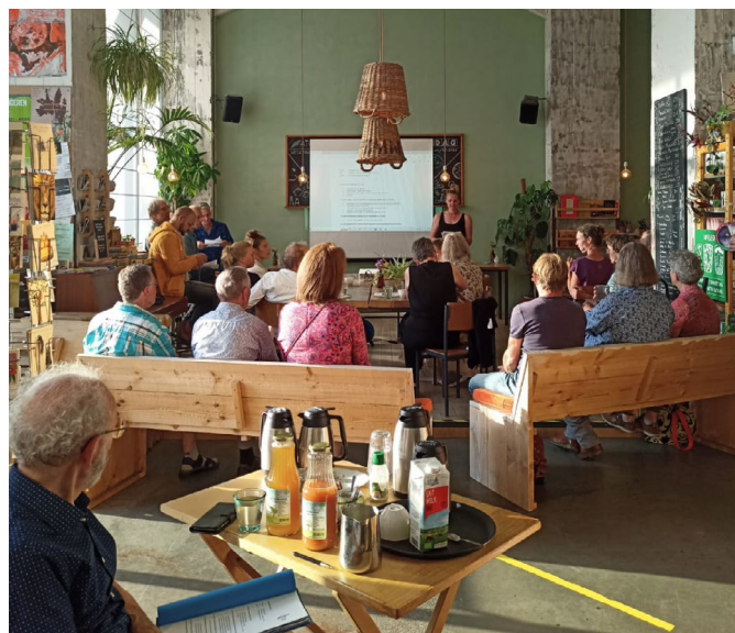
Een zomerse algemene ledenvergadering in juni.