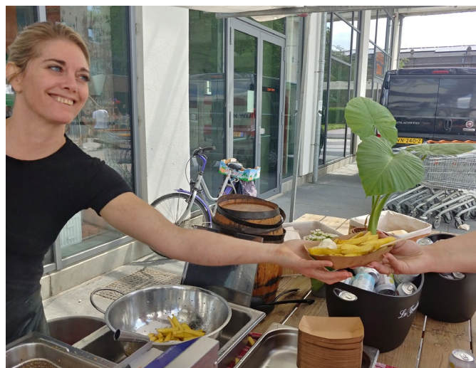
Het Sphinxkwartier organiseerde in juli een grote markt: de Sphinxmarkt. De winkel was open op deze zondag, met overal proeverijtjes en gezelligheid.