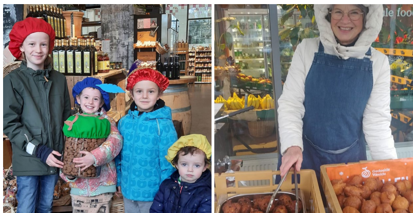
Het meest memorabel van Terug- en Vooruitkijken in 2022 was de ledendag in oktober.