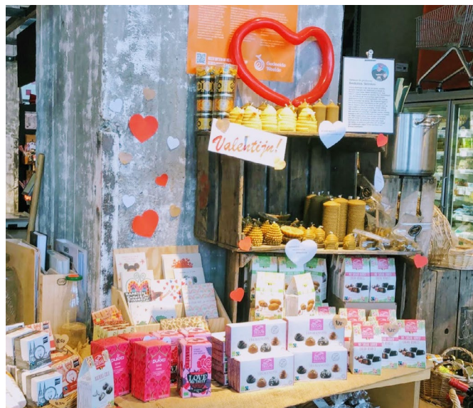
Valentijnsdag bij Gedeelde Weelde.