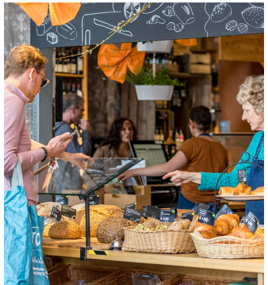
Toen de koning op 27 april Maastricht bezocht, kleurde ook Gedeelde Weelde dieper oranje dan normaal.