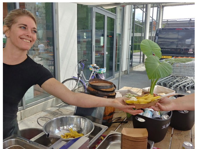
Het Sphinxkwartier organiseerde in juli een grote markt: de Sphinxmarkt. De winkel was open op deze zondag, met overal proeverijtjes en gezelligheid.