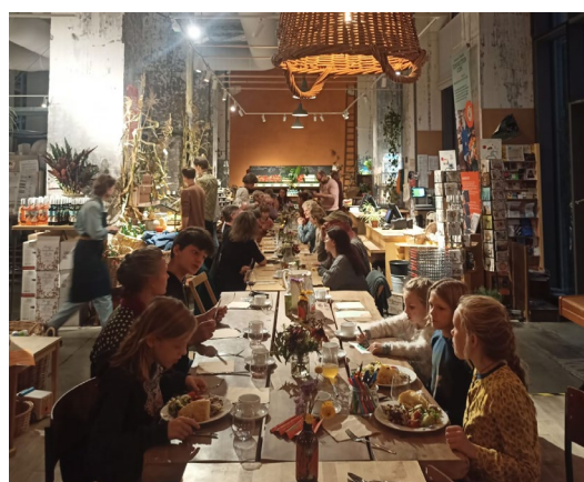
Tijdens de Oogstweek in september vierden we onze producenten en de oogst. We sloten de week af met een etentje voor meewerkende leden.