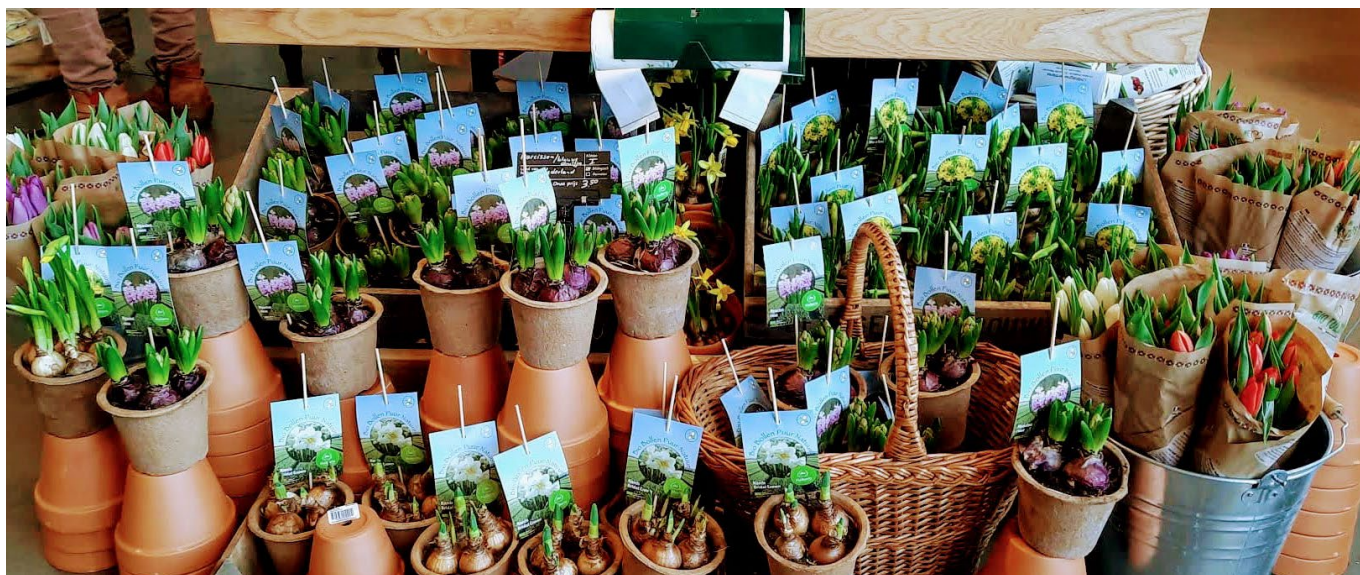
In maart werden de bloemetjes buiten gezet.