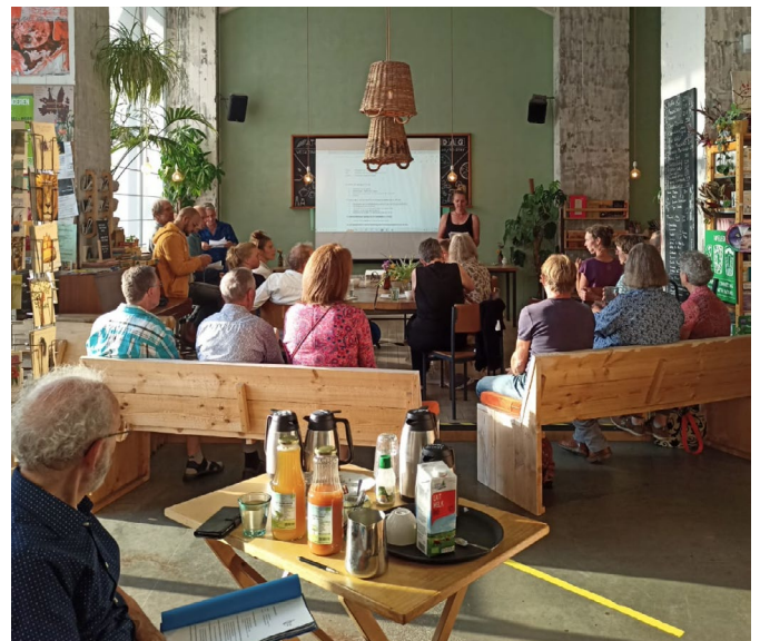
Een zomerse algemene ledenvergadering in juni.