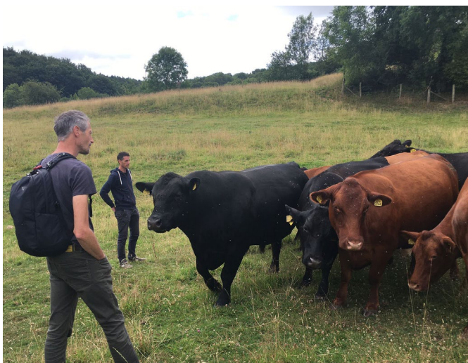
In juli organiseerden we een wandeling door het Heuvelland en bezochten we de runderen van Boerderie Bewust.