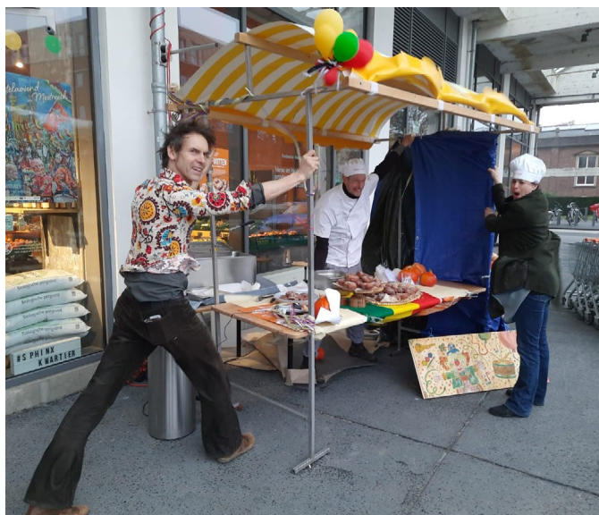
In de week vóór Carnaval verkochten enthousiaste bakkers van Gedeelde Weelde enkele duizenden nonnevotten.