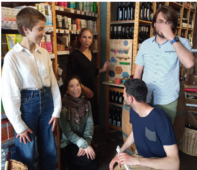
In mei transformeerde Precious Plastics ons plastic afval in een bijzondere collectie sieraden en producten.