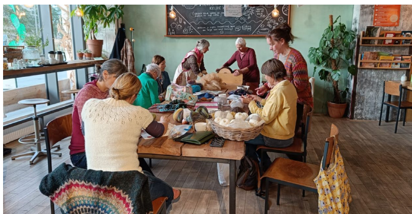
In oktober was er een gezellige haak- en breimiddag voor en door leden.